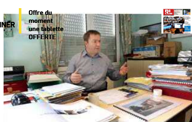
Le Sivocs mise sur une école unique d'ici 2020

PLUS D'ARTICLES EDITION DE SAINT-AVOLD CREUTZWALD →