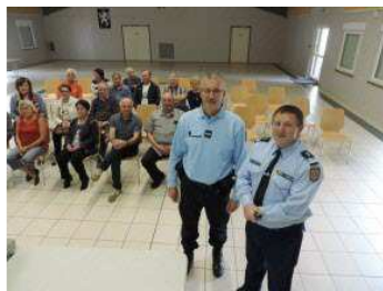
Varsberg : la vigilance est l'affaire de tous