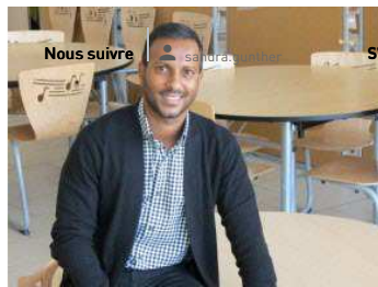
Freistroff : périscolaire cherche animateur(s)